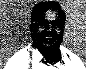
Prof. Siddaramaiah Minister of Agriculture, Government of Karnataka

9845-2740231, 08-0004-50, FT MILLET & MILLET FOOD COURT THE MUSEUM, BANGALORE